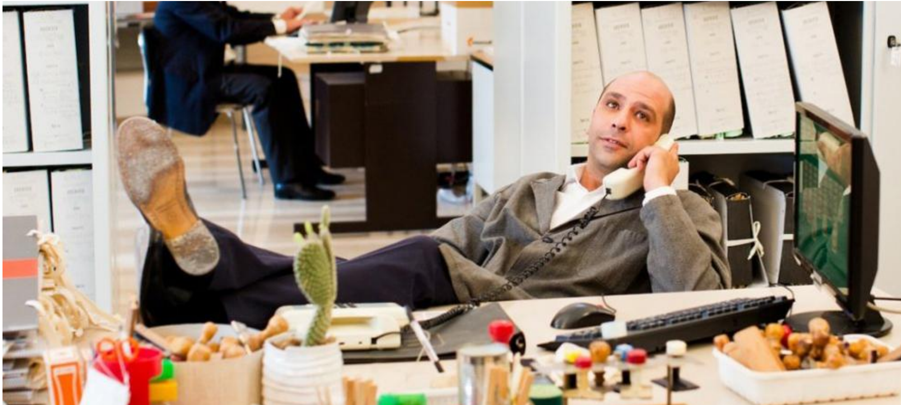
Immagine tratta dal film "Quo vado?" (2016)